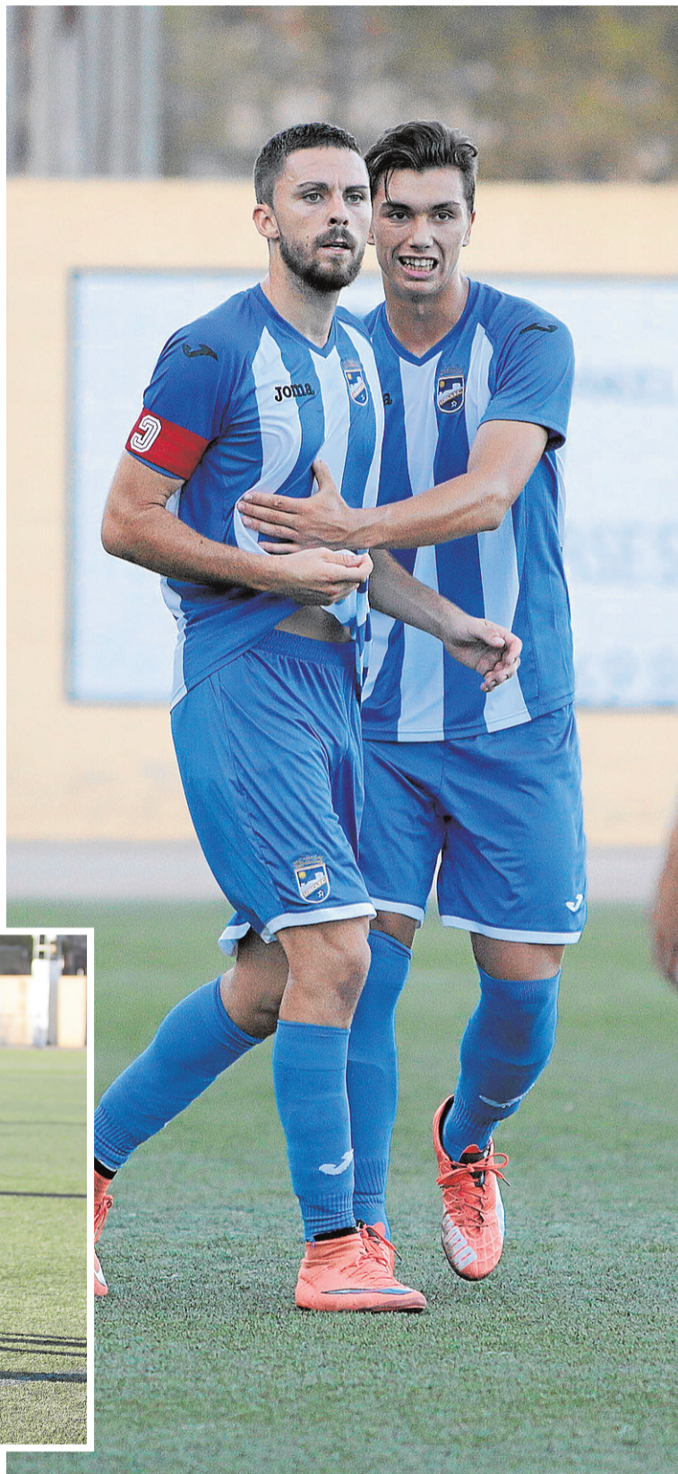
Partido de pretemporada del Lorca FC B.