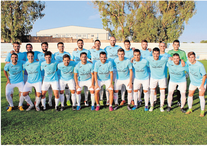
Plantilla del CF Muleño para esta temporada.