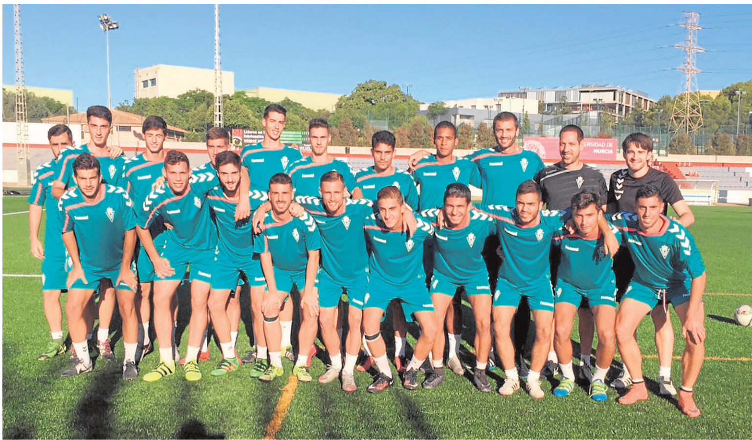
Plantilla y cuerpo técnico del Real Murcia CF Imperial, tras un entrenamiento.