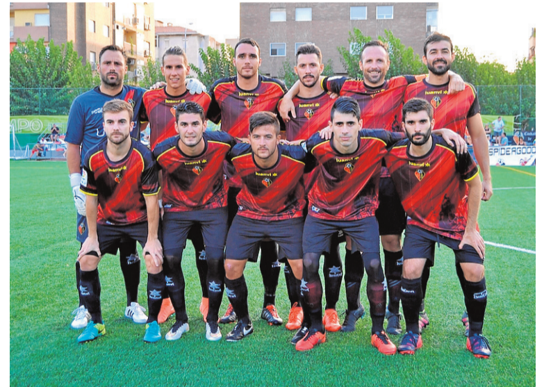
El Ciudad de Murcia inicia una nueva temporada en Tercera.