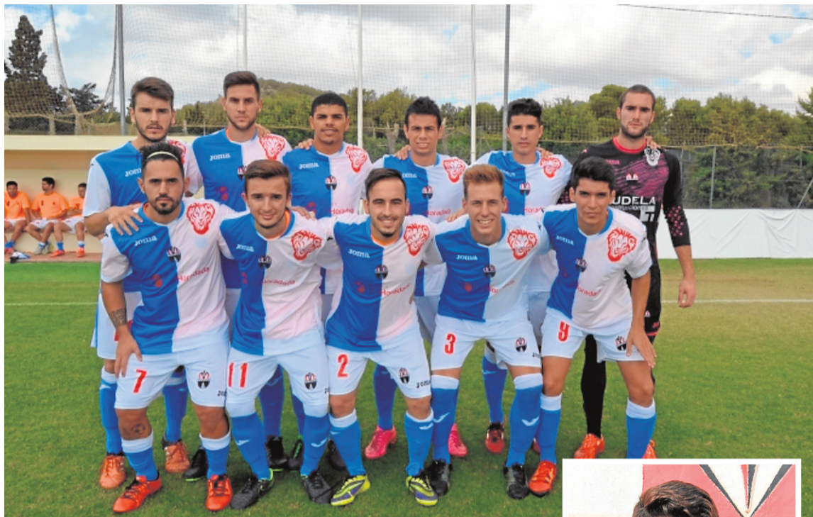
Once de inicio del CD Algar en pretemporada. A la derecha, Popy ■ ALGAR

Los jugadores que han venido a reforzar al club responden a un perfil de futbolista joven de la zona, con muchas ganas e ilusión de mostrar