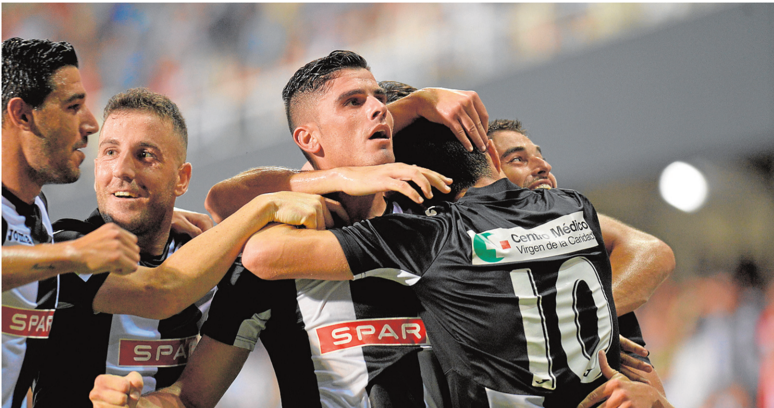
El Cartagena ha arrancado la temporada ganando con solidez al Linares. Los jugadores se abrazan tras la consecución del primer gol