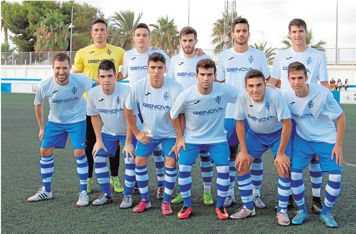
Once titular del FC Pinatar. :: FC PINATAR