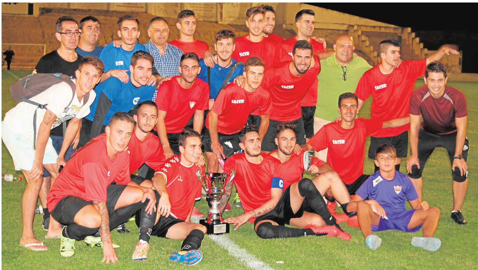
Plantilla del Cieza tras la consecución de un trofeo amistoso esta pasada pretemporada.