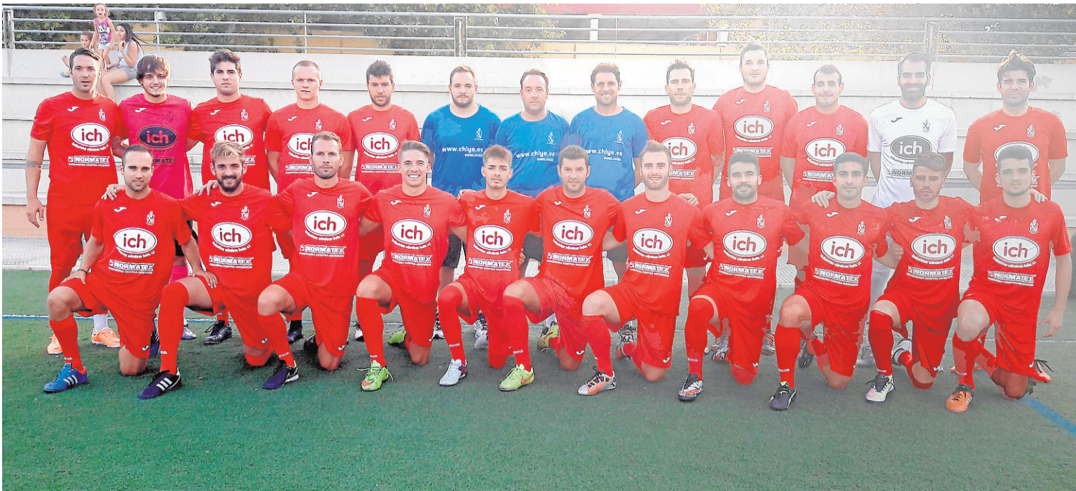
Plantilla de Estrella Grana El Palmar CF. :: EL PALMAR C.F.