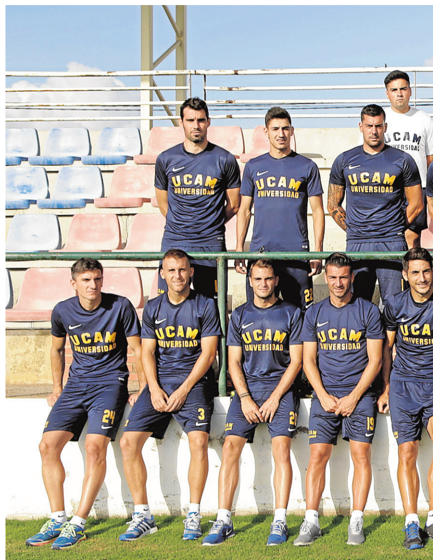
Plantilla y cuerpo técnico del Ucam CF en su estreno en Segunda División A.