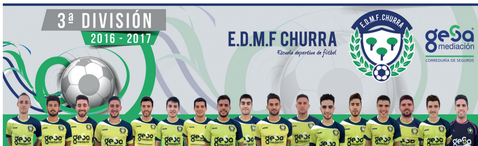
Plantilla del EDMF Churra de cara a esta temporada 2016/17 :: EDMF CHURRA