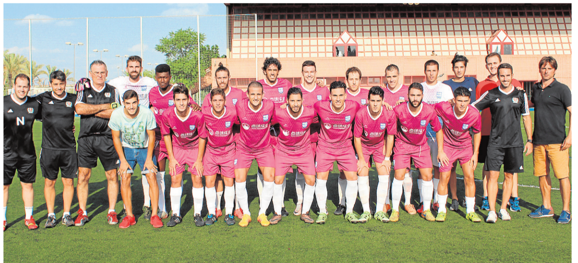
Plantilla de Nueva Vanguardia para esta temporada 2016/17 con parte del cuerpo técnico.