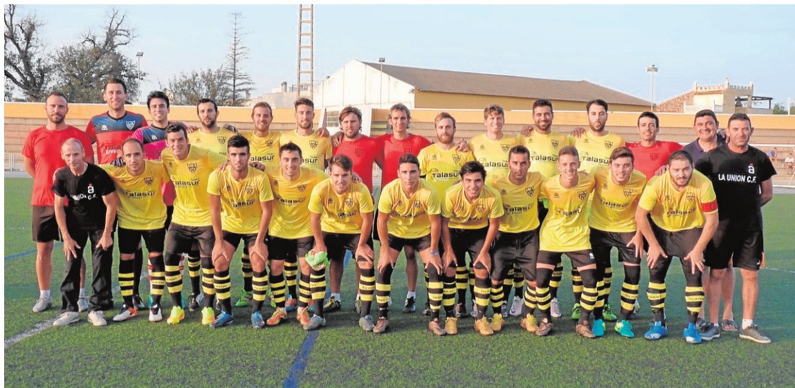
Plantilla de La Unión de cara a esta temporada 2016/17. ■ LA UNIÓN C.F.

Para llevar a buen término el objetivo de colarse entre los cuatro primeros clasificados, la directiva de La Unión ha apostado por una renovación importante de la plantilla, que incluye refuerzos en todas las líneas de juego, para lo que no ha dudado en acudir a futbolistas con gran experiencia en la categoría, sin renunciar