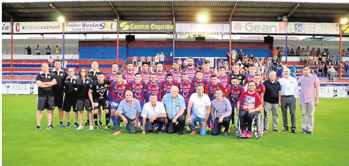
Plantilla y cuerpo técnico del Yeclano Deportivo :: YECLANO DEPORTIVO

El equipo está en formación, jugadores conociéndose, pero lo que se