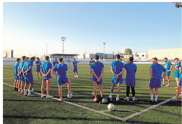
Entrenamiento del Mar Menor en el Pitín a las órdenes de Lilo. ■ M.M.

Igualmente, la aportación de sus patrocinadores es importante para el devenir de este club histórico convertido en leyenda.