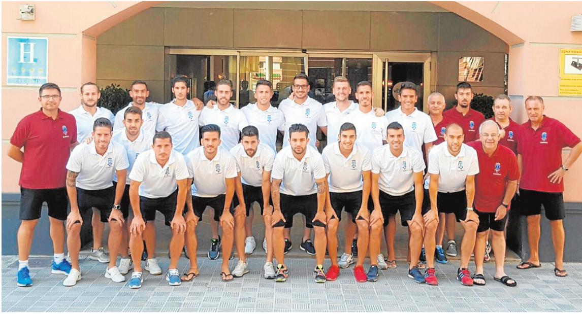
Plantilla y cuerpo técnico del Jumilla FC :: JUMILLA FC.