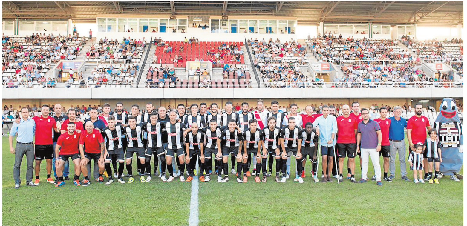
Equipo y cuerpo técnico durante la disputa de la Carabela de Plata en el Cartagonova.