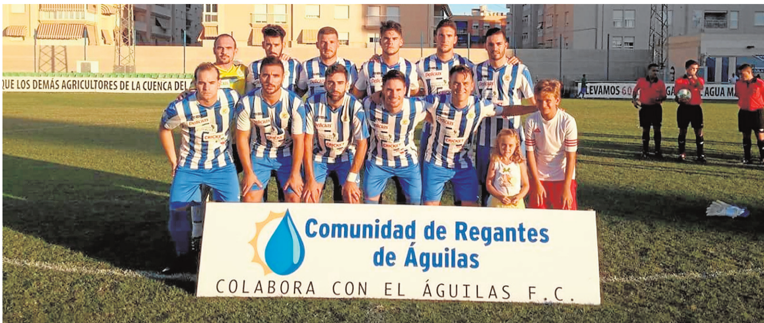
Once de inicio del Águilas FC en un partido de pretemporada.