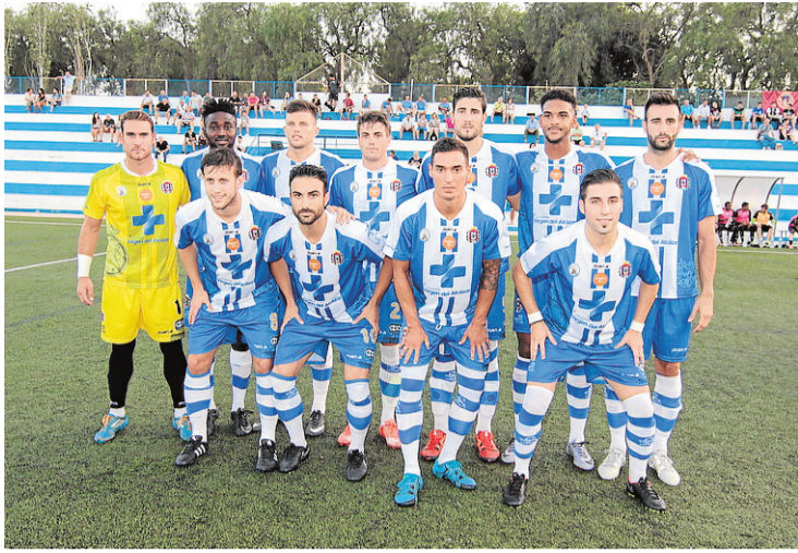
Once del Lorca Deportiva en un partido de pretemporada.