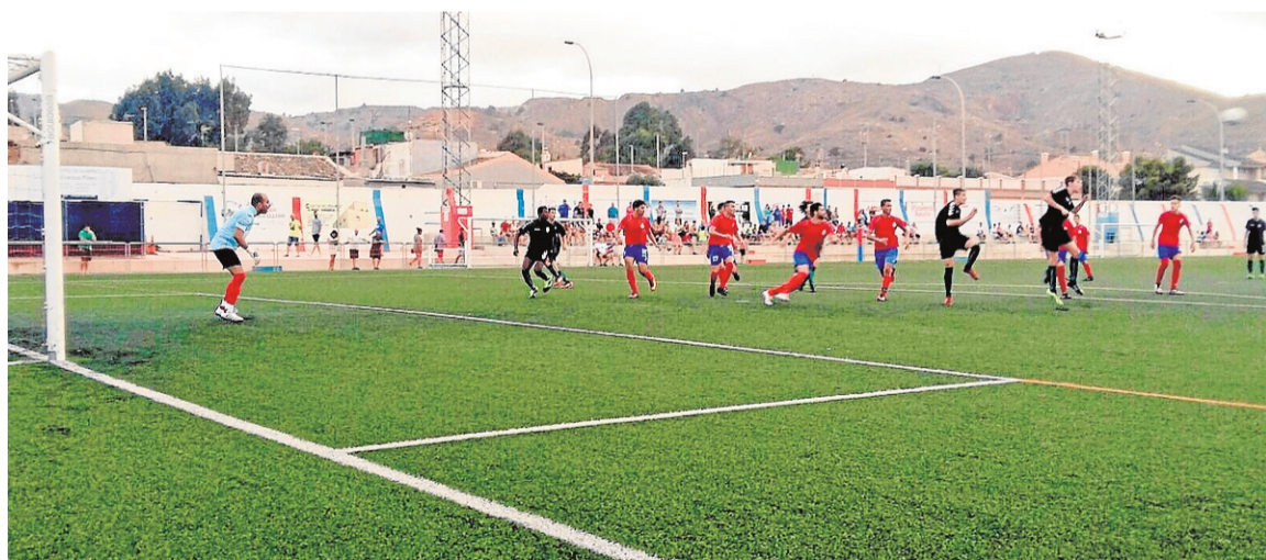
La Deportiva Minera, en un encuentro de pretemporada jugado en su campo. ■ UCAM CF

La pretemporada ha transcurrido con normalidad, con muchos jugadores haciéndose valer y pidiendo una oportunidad a Juan Lillo. Las pruebas ante rivales de entidad como Granada, Cartagena, Real Murcia u Orihuela, han permitido ir dibujando la composición del equipo.