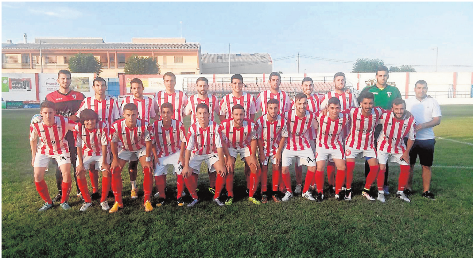
Plantilla y cuerpo técnico del Olímpico de Totana de cara a esta temporada 2016/17.