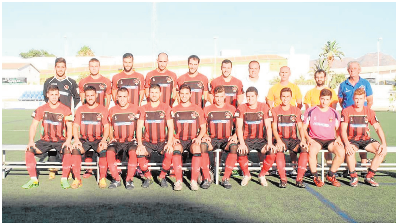
Plantilla del Club Atlético Pulpileño de cara a esta temporada 2016/17 :: C.A. PULPILEÑO