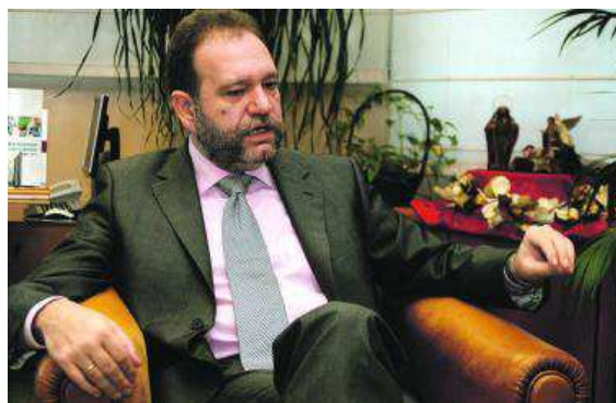
Constantino Sotoca Carrascosa, consejero de Educación.

-Así es. Las nuevas tecnologías no solo aportan valor añadido en estos momentos, sino que ofrecen también un plus educativo. En la sociedad del siglo XXI, el manejo y el conocimiento de estas herramientas resulta imprescindible y además su uso dentro del contexto educativo tiene una incidencia muy positiva en el aprendizaje y en la mejora del rendimiento escolar. Por eso, la Consejería lleva años impulsando diferentes iniciativas que nos están permitiendo integrar definitivamente las TIC en las aulas de la Región, con programas como 'Aula XXI' o 'Plumier'; con proyectos de mejora de la competencia digital como 'Mi e-scuela'; y con inversiones que han permitido a los centros disponer de infraestructuras, de pizarras digitales, vi-