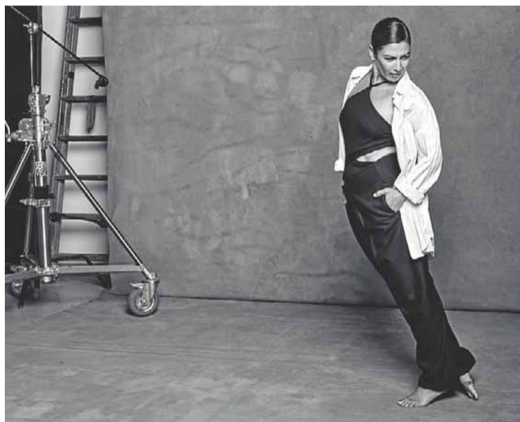
Sara Baras pondrá en escena en Cartagena 'Vuelo'.