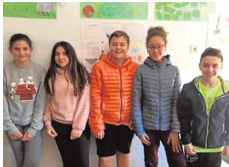
Los Metamórficos, grupo de 1º de ESO del IES Juan Sebastián Elcano.

En total, van a ser tres semanas intensas a la caza de la noticia que arrancarán apenas un día después de que finalice el plazo de inscripción, fijado para el próximo 10 de febrero. La inminente edición del concurso 'Mi Periódico Digital' está patrocinada por Hospital Quirónsalud Murcia, centro comercial Thader (Murcia), Grupo Fuertes e Iberdrola.