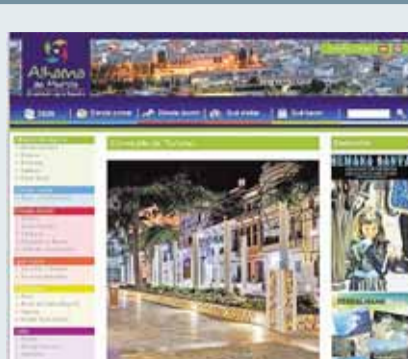
Turismo Alhama de Murcia