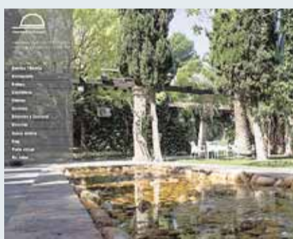
El Estudio de Ana

Autor: ACCESIUM Technology Propietario: Campus Mare Nostrum Noticias de las actividades del Campus.