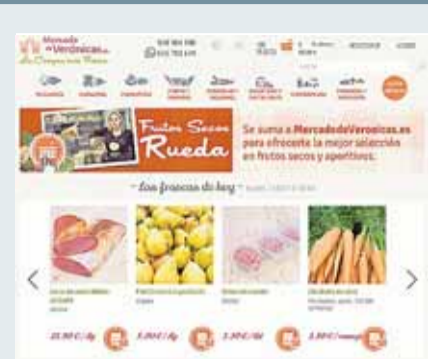
Mercado de Verónicas