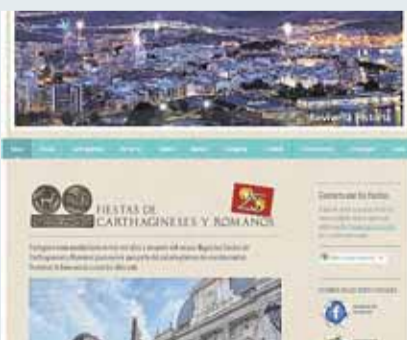
Carthagineses y Romanos

Propietario: Portavoz Llamativa campaña con videojuego.