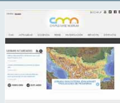
Campus Mare Nostrum

Autor: Avatar Internet S.L.L. Propietario: Concejalía de Turismo Lugares emblemáticos de Alhama.