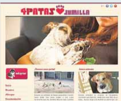
4 Patas Jumilla