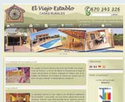
El Viejo Establo